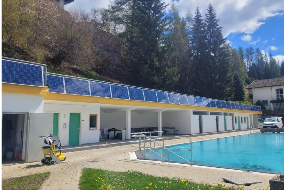
Bild 9: PV-Anlage Sonnenterasse Schwimmbad

Solarthermie Weiters befand sich auf dem Dach des Seniorenheims eine thermische Solaranlage mit einer Fläche von ca. 50 m 2 . Die daraus erzeugte Energie wurde zur Gänze zur Warmwasserbereitung des Seniorenheims verwendet.