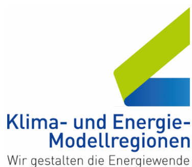
Bild 4: Logo Klima- und Energie-Modellregionen

Klimawandel-An- passungsmodell- regionen (KLAR!)