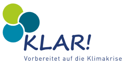
Bild 5: Logo Klimawandel-Anpassungsmodellregionen

Ein weiteres Programm des Klima- und Energiefonds waren die Klimawandel-Anpassungsmodellregionen (KLAR!). Ziel des Programmes war es, Regionen und Gemeinden auf die Folgen des Klimawandels vorzubereiten und Anpassungsmaßnahmen durchzuführen. Auch bei diesem Programm bestand die Förderung grundsätzlich aus der Kofinanzierung von Personalkosten. Zur Zeit der Überprüfung nahmen 35 Gemeinden in Tirol an diesem Programm teil.