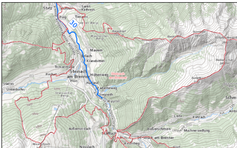
Bild 18: „30 Wipptalradweg“ (blaue Linie) auf dem Gebiet der Marktgemeinde Steinach am Brenner