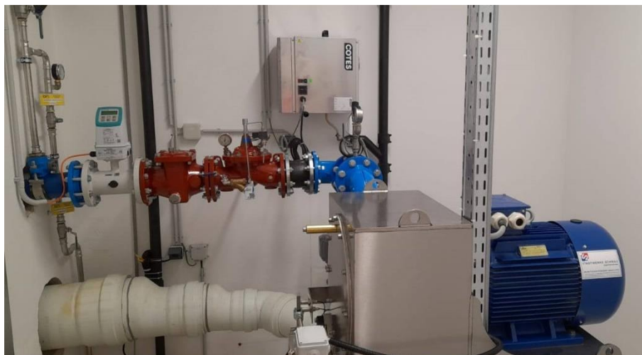
Bild 7: Trinkwasserkraftwerk Gemeindeamt