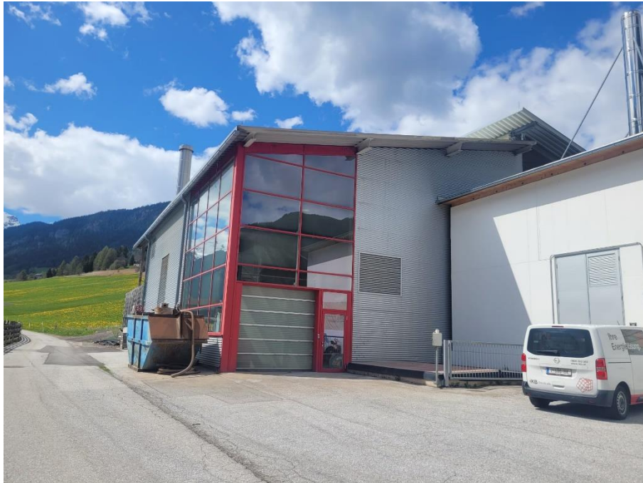
Bild 11: Bio Heizwerk

Die Marktgemeinde Steinach am Brenner bezog die Wärme für ihre Gebäude und Anlagen überwiegend von der Bio Heizwerk Steinach a. Br. GmbH. Dieses Unternehmen wurde im Jahr 2006 gegründet und betrieb ein Nahwärmenetz im Gemeindegebiet von Steinach am Brenner. Es versorgte zur Zeit der Überprüfung 127 Anlagen mit jährlich 8,2 GWh Wärme. Laut Angaben des Unternehmens wurde ca. 91 % der Wärmeerzeugung mit erneuerbaren Brennstoffen gedeckt. Das verwendete Waldhackgut stammte zum überwiegenden Teil aus einem Einzugsgebiet von weniger als 50 km. 41