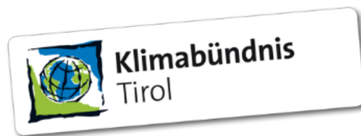
Bild 2: Logo Klimabündnis Tirol

Der im Jahr 1998 gegründete Verein Klimabündnis Tirol mit Sitz in Innsbruck hatte eine Vielzahl von Angeboten an Gemeinden, um die Klimaschutzarbeit zu unterstützen. Der Verein bot den Gemeinden u.a. Beratungen und Schulungen im Bereich der Radmobilität, der Kommunikation zu klimarelevanten Themen und zur Ausbildung für kommunale Klimabeauftragte an. Weiters führte der Verein einen „KlimaCheck“ bei Gemeindegebäuden durch und zeigte Potenziale für ein nachhaltigeres Standort-Management auf. Zur Zeit der Überprüfung waren 80 Tiroler Gemeinden Mitglied im Klimabündnis Tirol.