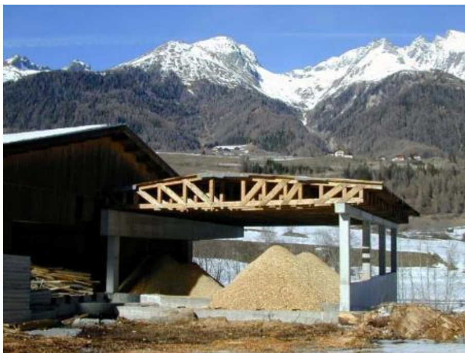
Bild 12: Hackschnitzellager Dorfwärme Virgen

Errichterin und Betreiberin dieser Anlage war die Regionalenergie Osttirol reg. Gen.m.b.H. Dieses Unternehmen war genossenschaftlich organisiert und betrieb 18 Heizwerke in 15 Osttiroler Gemeinden. Die Gemeinde Virgen war kein Mitglied dieser Genossenschaft, sondern lediglich deren Kunde. Mitglieder und Lieferanten des benötigten Brennholzes waren hingegen die Agrargemeinschaften Virgen-Wald und Mitteldorf sowie örtliche Waldbesitzer.