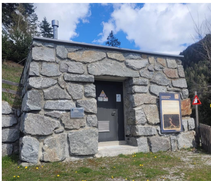
Bild 8: Trinkwasserkraftwerk Padaster

Mit den drei selbst errichteten Anlagen konnte die Marktgemeinde Steinach am Brenner über das Gemeindestromnetz den Großteil des Strombedarfs der kommunalen Gebäude abdecken. Die in der Anlage „Sill II“ erzeugte Energie wurde hingegen zur Gänze als Strom in das öffentliche Stromnetz eingespeist (Volleinspeisung).