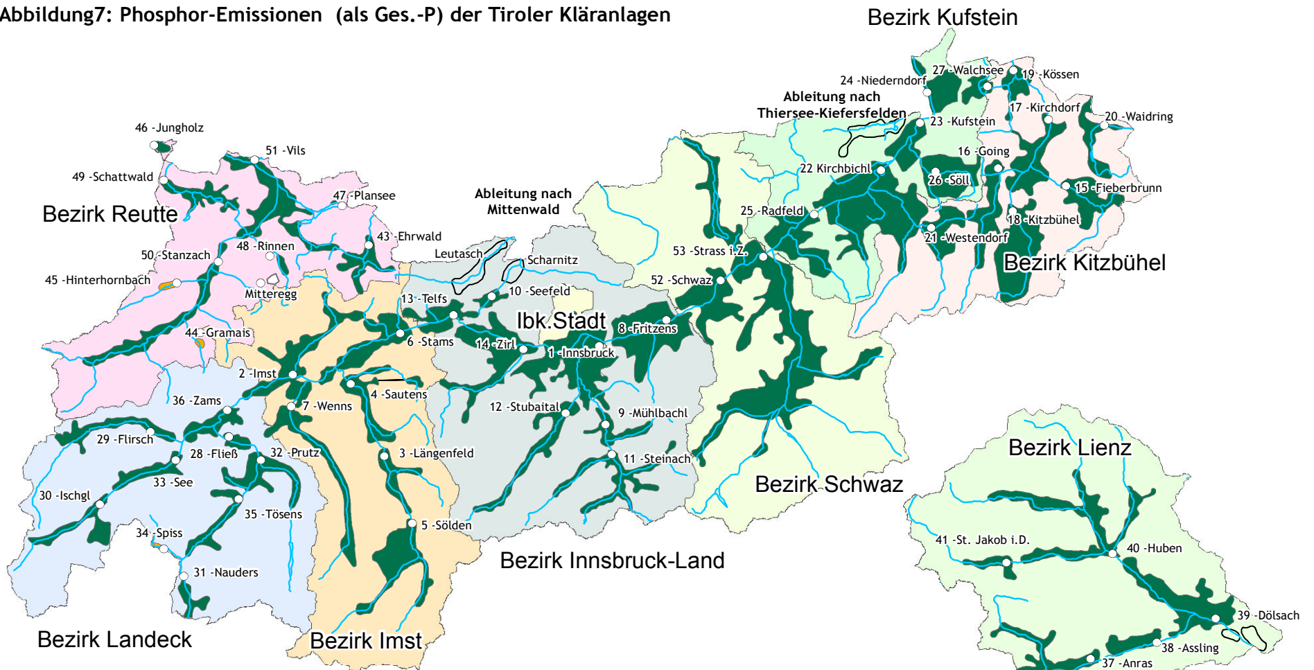
Abbildung 7: Phosphor-Emissionen (als Ges.-P) der Tiroler Kläranlagen