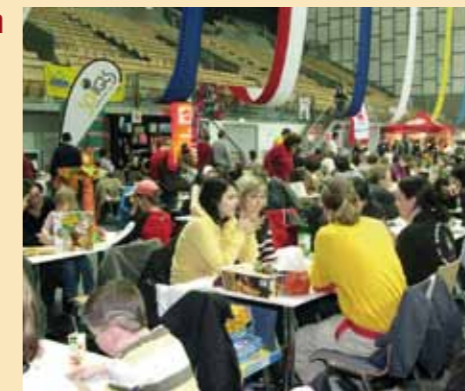
Trotz Spielanleitung Endstation? Die Spielefeuerwehr in ihren gelben T-Shirts weiß immer Rat.

Um sich die Spiele zum Test vor Ort ausleihen zu können, brauchen Sie zunächst einen Spielepass. Er dient als Einsatz (siehe Kasten rechts). Das ideale Familienspiel ist schnell erklärt, hat einfache Regeln und dauert auch nicht zu lange. Von dieser Sorte gibt es auf der Spielmesse eine ganze Menge zum gemeinsamen spielerischen Erproben. Wer trotzdem einmal nicht mehr weiterweiß oder sich für ein schwierigeres Spiel entschieden hat, der kann sich an eine(n) der SpieleexpertInnen wenden, die sich im Vorfeld der Messe mit dem Spieleangebot speziell auseinandergesetzt haben und als „Spielefeuerwehr“ bereitstehen.