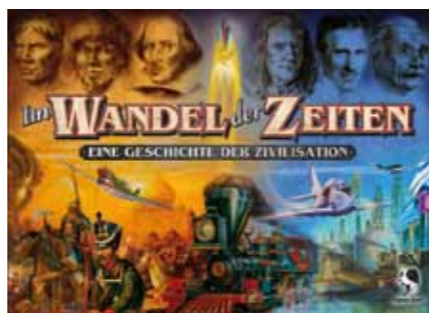
Bei den Munchkin-Turnieren von PEGASUS gibt es wieder Preise zu gewinnen, wie etwa dieses Spiel.

Täglich gibt es die sogenannten „Munchkin“-Turniere. Turnierstart ist jeweils um 13 Uhr. Hingehen, Zeit nehmen und mitmachen!