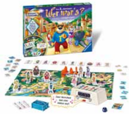
„Wer war's?“ – Diese Frage wird unter anderem am Ravensburger-Spielestand beantwortet.

Von Beginn an dabei und immer wieder ein besonders beliebter Treffpunkt ist der Ravensburger-Spielestand. Auch heuer werden die Ravensburger-Spieleexperten mit den BesucherInnen wieder zahlreiche Spieleneuheiten für Jung und Alt spielen. Schlag den Raab, Nino Delfino, Krawall vorm Stall, Seeland, Asara, Wer war's?, Schräghausen, MNB Junior oder das Brettspiel Phase 10 sind nur einige prominente Beispiele aus dem neuesten Ravensburger-Spieleangebot.