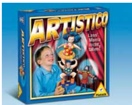
Ausgezeichnet mit dem Spielepreis „Spiel der Spiele für Kinder 2010“: Artistico von PIATNIK.

Die traditionsreiche Wiener Spielkartenfabrik Ferd. PIATNIK & SÖHNE präsentiert heuer eine sehr persönliche Geschenkidee: Auf der neuen Website www.piatnik-individual.com stehen viele der bekannten Spielkarten-Bilder aus dem Hause PIATNIK für kreative Gestaltungsideen und sehr persönliche Geschenke zur Auswahl. Online auswählen, gestalten und bestellen. Ein ganz persönliches Kartenspiel gestalten.