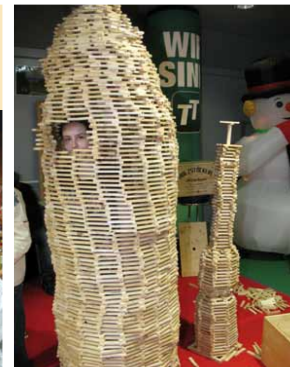
Auch heuer dürfen sich die Stöckln wieder türmen.