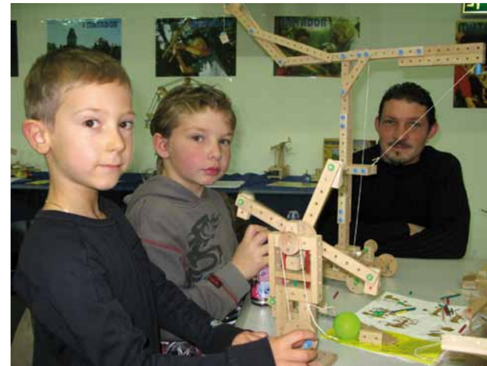
MATADOR – ein österreichischer Hit für Kinder seit Generationen.

Immer wieder ein Renner bei der spielaktiv und so einfach: handgemachte Holzstöckln vom Aicherbauer aus Salzburg und sonst nichts. Schnell entstehen im Laufe der spielaktiv meistens die tollsten Kunstwerke.