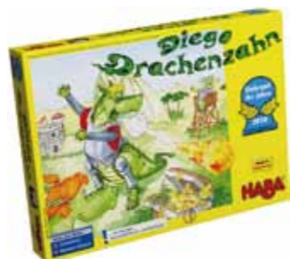
Sonderpreis „Kinderspiel des Jahres 2010“: Diego Drachenzahn von HABA.

„Diego Drachenzahn“ heißt das Spiel von HABA, das mit dem Preis „Kinderspiel des Jahres 2010“ ausgezeichnet wurde. Es ist eines der vielen besonders kreativen HABA-Spiele, die am Ausstellungsstand der Innsbrucker „Spielebörse“ ausprobiert werden können.