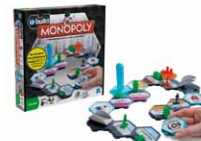
Monopoly von HASBRO: Der Renner dieser Spielesaison – das berühmte Spiel in neuer Form.

stellungsstand in der Olympiahalle. Das bekannte Spiel „Monopoly“ kann hier in der neuen, von der aktuellen Fernsehwerbung bereits gezeigten Fassung als Baukastensystem ausprobiert werden. Daneben gibt es eine Reihe anderer toller Neuheiten, die Spaß für die ganze Familie garantieren.