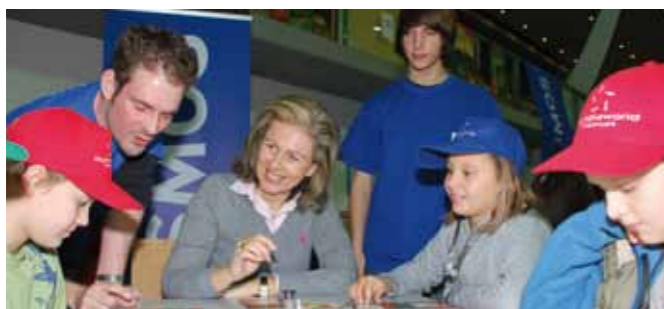
Die spielaktiv soll ein Fixpunkt im Veranstaltungskalender des Landes Tirol bleiben und damit auch ein besonders angenehmer Pflichttermin im Kalender von Familienlandesrätin Patrizia Zoller-Frischauf.

Die Busse der IVB erreichen das Tivolistadion mit den Linien A, J, S und T. Auch eine Postbushaltestelle (vom Bahnhof Richtung Mittelgebirge) befindet sich unmittelbar beim Olympiastadion.