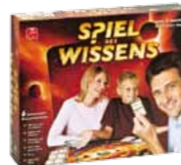
Das Spiel des Wissens von JUMBO bietet Spaß und Spannung für die ganze Familie.

JUMBO präsentiert sich auch heuer wieder mit einem eigenen Stand mit Spielen für die ganze Familie. Für die kleinen Besucher ab 3+ ist mit dem Spiel „Schloss Logikus“ aus der Smart Games Reihe für