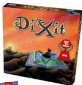
DiXit von ASMODEE – Spiel des Jahres 2010.

Die zwei Verlage ASMODEE und AMIGO durften sich heuer über zwei begehrte Spielepreise freuen. Das Spiel DiXit 3D der Firma ASMODEE wurde zum Spiel des Jahres 2010 erklärt. AMIGO darf sein Spiel ATLANTIS ab heuer als Spiel der Spiele 2010 bezeichnen. Beide Spiele gibt es natürlich an unseren Ludotheken auf der spielaktiv .