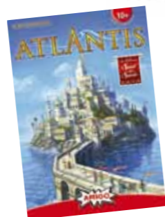
ATLANTIS von AMIGO – Spiel der Spiele 2010.