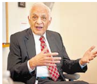
TT-Smalltalk mit Bose-Gründer und MIT-Professor Amar Bose.