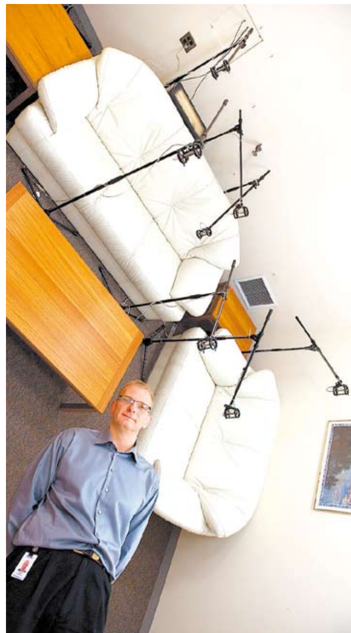
An die Wand geschraubt, damit ja nichts verrückt: Seit 15 Jahren ist alles exakt am gleichen Ort, um Lautsprecher zu vergleichen.