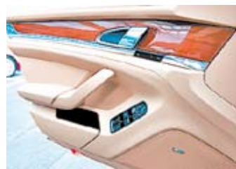
Bis zu 21 Boxen: Perfekter Sound im Auto ist eine Herausforderung.