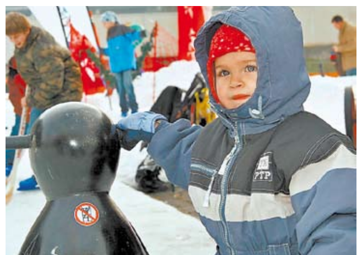
Auch am Eisring bietet die Spiele- und Familienfreizeitmesse heuer sportliche Abwechslung: Skifahren, Eislaufen und Eishockey.

bereitgestellt. Der Verleih aller Geräte ist kostenlos.