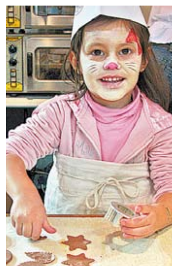
Ein buntes Rahmenprogramm rundet das Spieleangebot ab.

WEITERE INFORMATIONEN www.tirol.gv.at/familienreferat