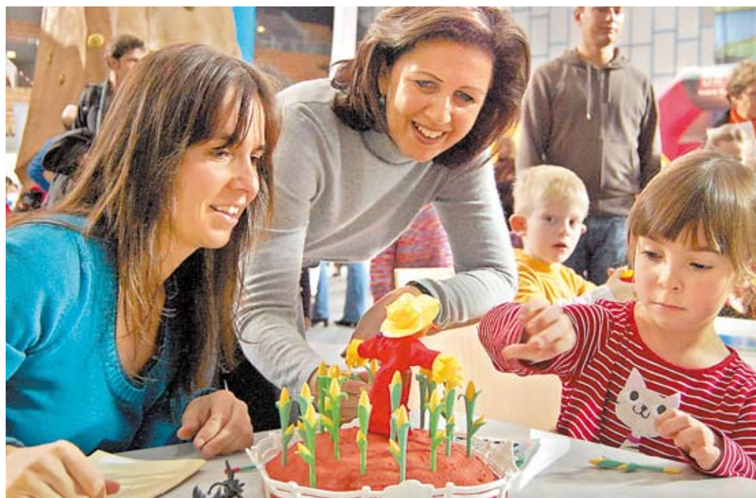
Gemeinsam Spieleneuheiten kennen lernen oder sich in Altbekanntem versuchen: Die spiel aktiv gibt Familien Anregungen für eine sinnvolle gemeinsame Freizeitgestaltung auch mit Sport.

Die Angebote am Eisring der Olympiaworld bieten Abwechslung zum Spielbetrieb. Eltern können ausprobieren, wie es um Talent und Begeisterung ihrer Kleinen in Bezug auf Wintersportaktivitäten aussieht, besonders wenn es um ein wintersportliches Weihnachtsgeschenk geht. Fachleute helfen bei den ersten Schritten am Schneehügel, der heuer vom Patscherkofel kommt. Am Eis können die Kleinsten erste Schritte versuchen. Eislaufschuhe stehen dafür bereit. Die größeren Kinder dürfen sich im Eishockey probieren. Die Grundausrüstung dafür wird