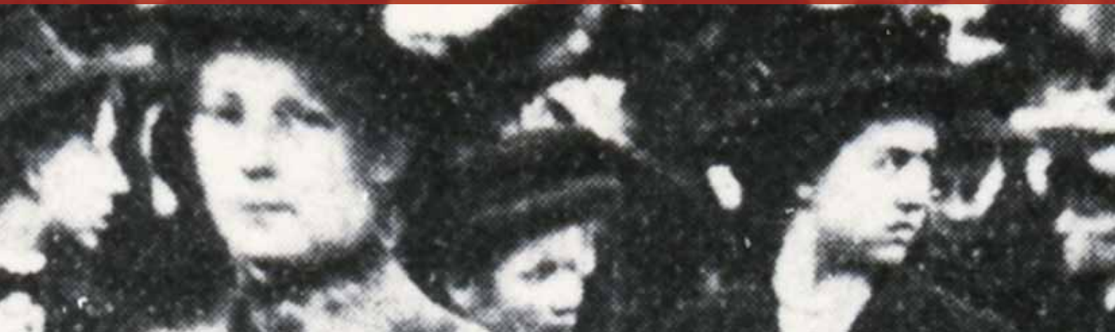
Demonstration zum 1. Frauentag 1911

MAGAZIN FÜR TIROLER*INNEN FACHBEREICH FRAUEN UND GLEICHSTELLUNG / ABTEILUNG JUFF