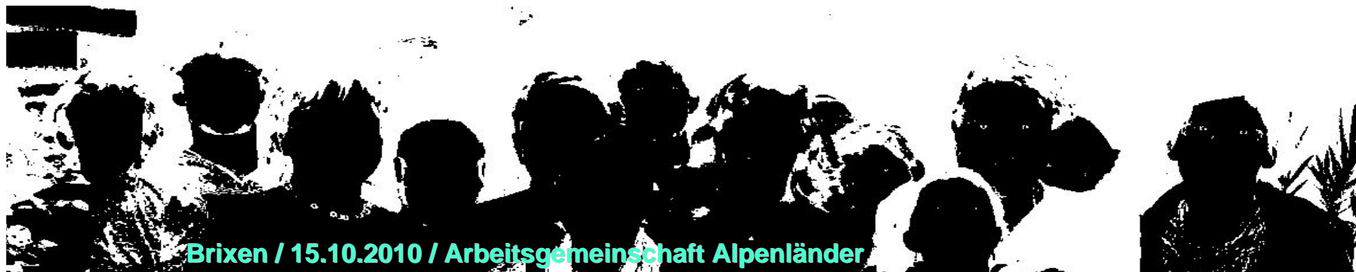
Brixen / 15.10.2010 / Arbeitsgemeinschaft Alpenländer