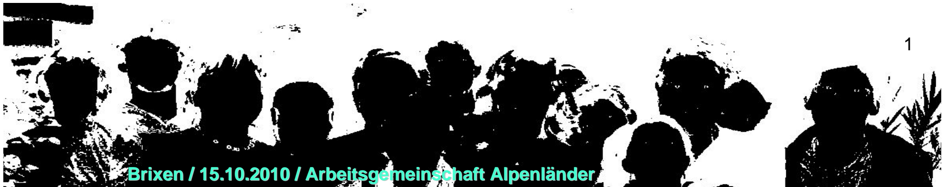
Brixen / 15.10.2010 / Arbeitsgemeinschaft Alpenländer