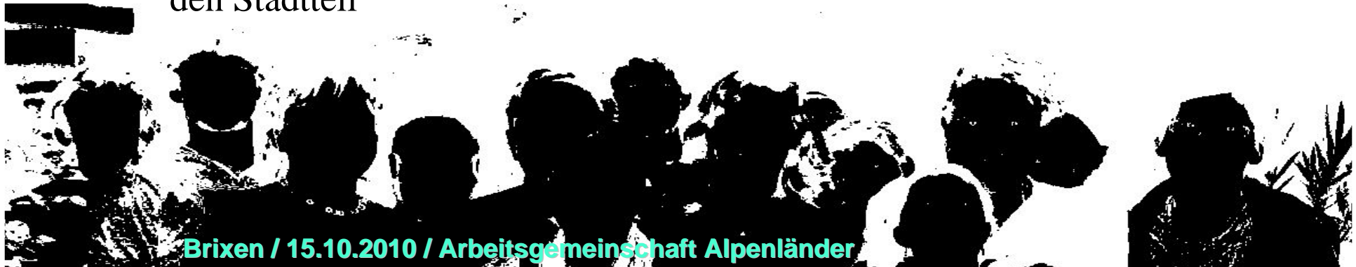
Brixen / 15.10.2010 / Arbeitsgemeinschaft Alpenländer