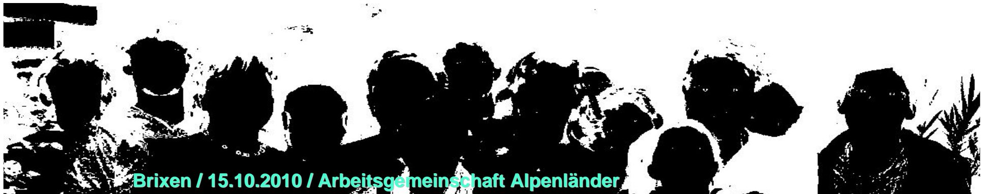
Brixen / 15.10.2010 / Arbeitsgemeinschaft Alpenländer

Migrantinnen und Migranten sind selbstverständlicher Bestandteil unserer Gesellschaft, ohne dass spezifische Programme erforderlich sind, die deren Teilhabe an zivilgesellschaftlichen Prozessen und ihr Engagementbedürfnis „behandeln“ bzw. bearbeiten müssen.