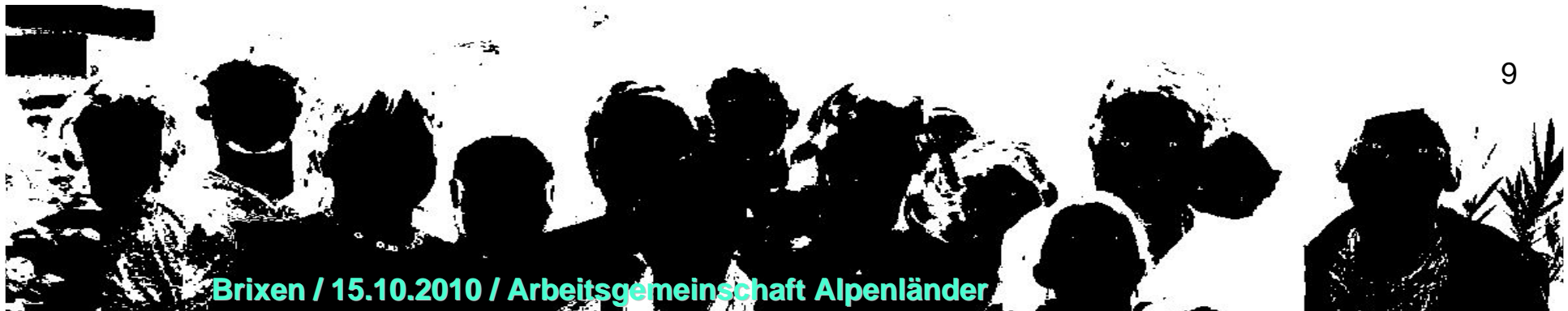
Brixen / 15.10.2010 / Arbeitsgemeinschaft Alpenländer