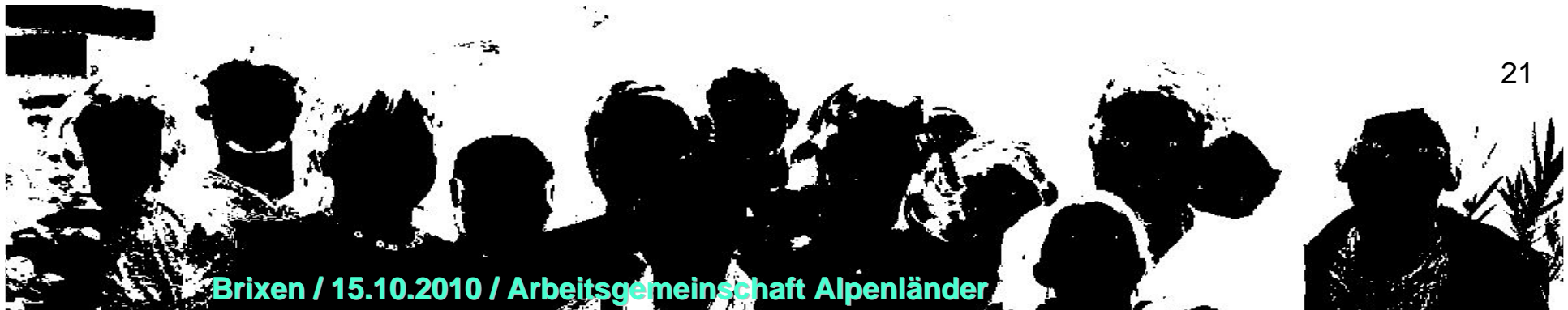
Brixen / 15.10.2010 / Arbeitsgemeinschaft Alpenländer

In den Bürgervereinen, in anderen Vereinen, Elternbeiräten, Initiativen und Projekten des Stadtteils engagieren sich nicht mehr nur alteingesessene Nürnberger/innen, sondern auch Zuwanderer/innen.