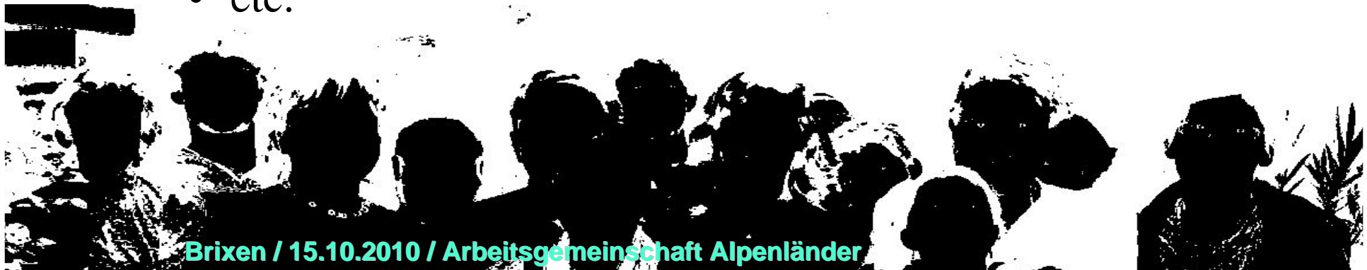
Brixen / 15.10.2010 / Arbeitsgemeinschaft Alpenländer