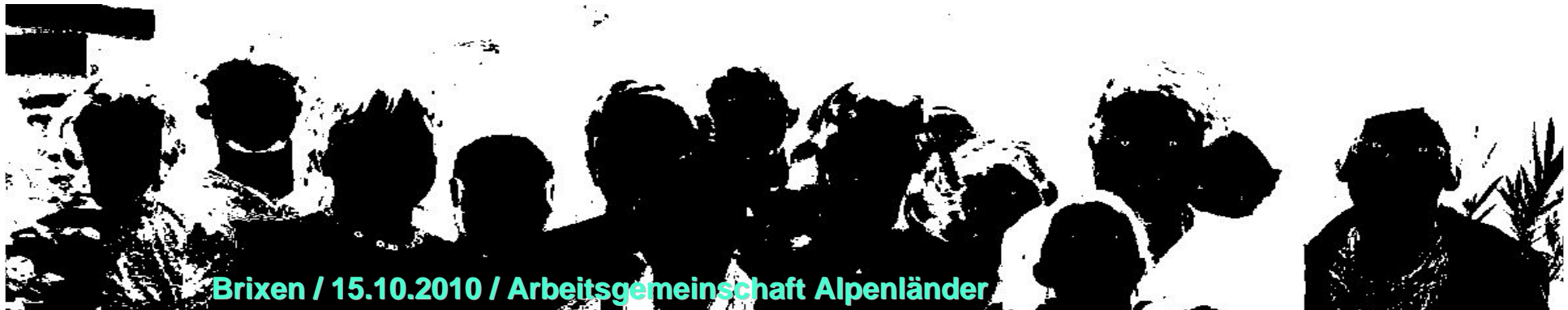
Brixen / 15.10.2010 / Arbeitsgemeinschaft Alpenländer