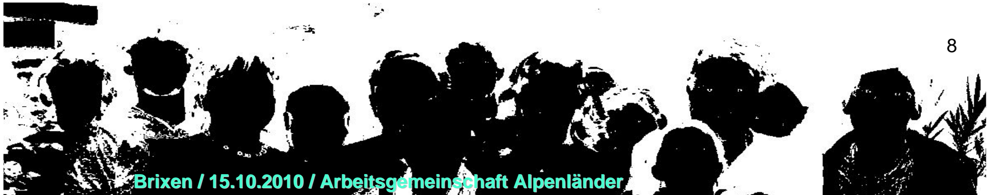
Brixen / 15.10.2010 / Arbeitsgemeinschaft Alpenländer