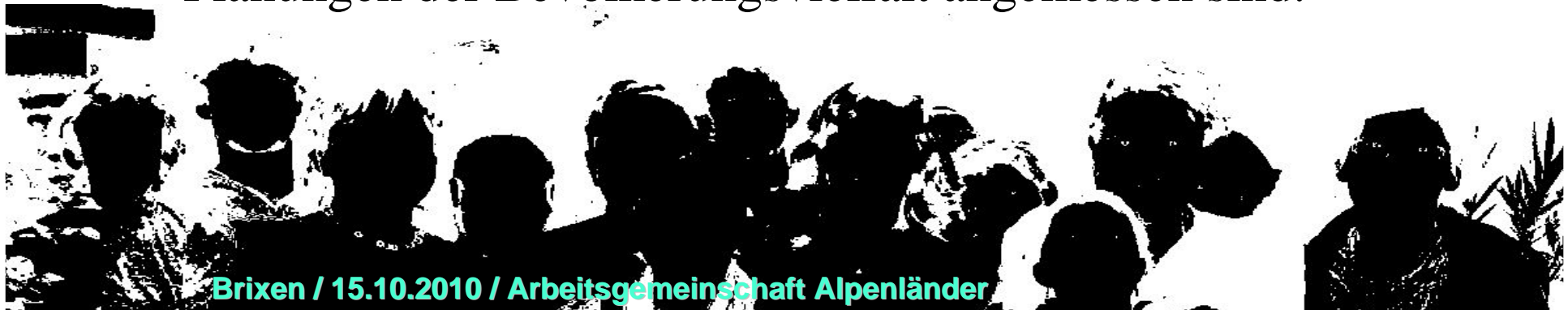
Brixen / 15.10.2010 / Arbeitsgemeinschaft Alpenländer

Bei allen städtischen Planungen wird geprüft, ob die Planungen der Bevölkerungsvielfalt angemessen sind.