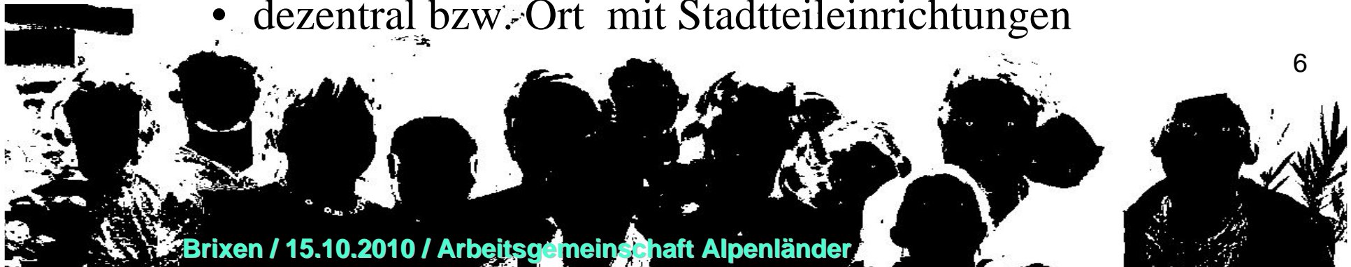
Brixen / 15.10.2010 / Arbeitsgemeinschaft Alpenländer