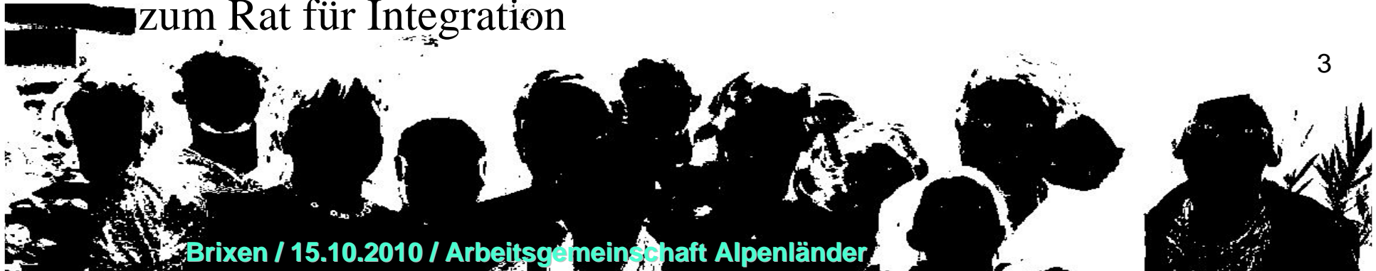
Brixen / 15.10.2010 / Arbeitsgemeinschaft Alpenländer