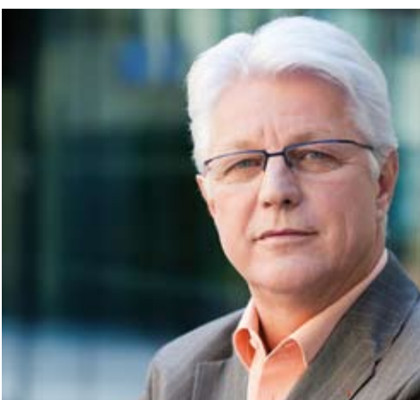
Gerhard Reheis, Landesrat für Soziales und Integration

Vor etwa 60 Jahren hat sich in Europa und somit auch in Tirol ein gesellschaftlicher Wandel vollzogen. Die Anwerbung von Gastarbeitern in den 70er-Jahren des vorigen Jahrhunderts, die Flucht zahlreicher Menschen aus den Kriegsgebieten des ehemaligen Jugoslawiens und die Öffnung der Grenzen im Osten Europas haben ebenso wie die wirtschaftlichen Krisenzeiten Wanderungsbewegungen bewirkt.