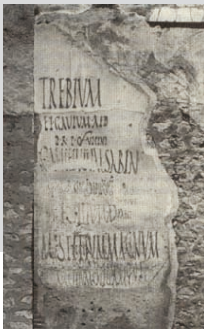
Abbildungen: Putzfragmente mit Wahlaufrufen, Pompeji.

Bei einer Analyse moderner Wahlkämpfe finden sich erstaunlich viele Elemente antiker Wahlkämpfe wieder. ■