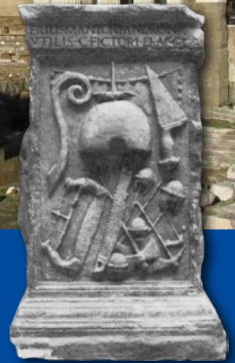
Altar der Fabri Tignuarii von Rom, Ausstattung in ihrer Funktion als Feuerwehr.

S chon seit republikanischer Zeit gab es in Rom und anderen Städten freiwillige Feuerwehren, die auch nach der Einführung einer Berufsfeuerwehr unter Augustus weiter bestanden.