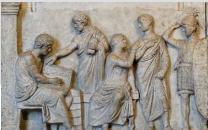
Abb. unten: Zensusrelief, ca. 100 v. Chr., Louvre