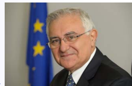
EU-Kommissar John Dalli

Verbraucher können sich zukünftig leichter darüber informieren, welche Zusatzstoffe für ein bestimmtes Lebensmittel zugelassen sind. Auch darüber hinaus wird die Verwendung von Lebensmittelzusatzstoffen bald noch sicherer und transparenter als bisher. Die Europäische Kommission hat diesbezüglich zwei neue Verordnungen verabschiedet.