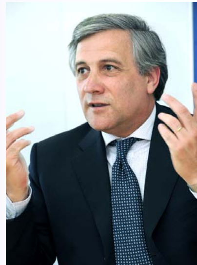
Antonio Tajani, Vizepräsident der Europäischen Kommission

„Dies ist ein wesentlicher Schritt hin zur Entwicklung und stärkeren Verbreitung von Elektroautos. Durch die Zusammenarbeit auf dem Gebiet der Rechtsvorschriften wird das Marktpotential für diese wichtige, bahnbrechende Technik zunehmen und so zur Wettbewerbsfähigkeit und zu einem nachhaltigen Straßenverkehr beitragen.“ Antonio Tajani, Vizepräsident der Europäischen Kommission und zuständig für Industrie und Unternehmen