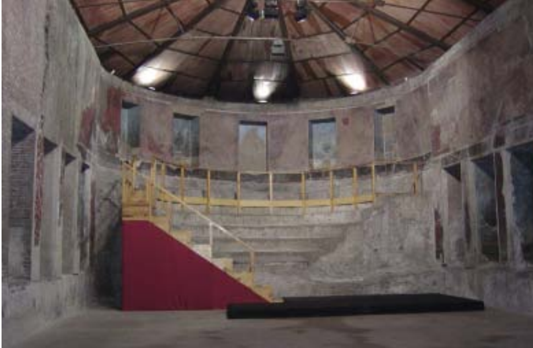
Sog. Auditorium des Maecenas, Rom