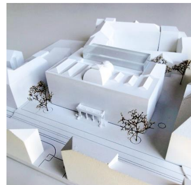
Südfassade / Eingang Museumsstraße