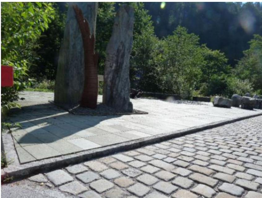
Bild 6: Pflasterung im Vordergrund ungeeignet

Das sagt auch die UN-BRK zum Recht auf Teilhabe. Das sind grundlegende Rechte für jeden Menschen.