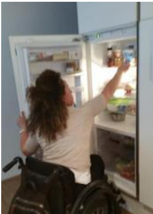
Bild 1: Einen Kühlschrank selbst bedienen

Grundsätzlich fühlten sich die Betroffenen viel selbstbestimmter und aktiver.