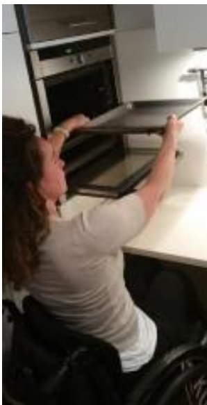
Bild 9: Selbstständiges Bedienen eines Backrohres

An dieser Stelle muss angemerkt werden, dass bei dieser Summe der Selbstbehalt, welchen Rollstuhlfahrer_innen zahlen müssen, nicht berücksichtigt wurde.