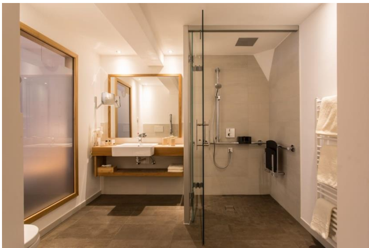
Bild 3: Barrierefreies Badezimmer, Bildnachweis: Hotel Weißseespitze 3

Man muss aber auch an Abstellräume, Vorräume, Türen, Balkone, Garten, Stufen, Treppen und Treppen-Lifte, Rampen, Eingänge, Kontraste und Beleuchtung, Brand-Schutz und Flucht-Wege, Park-Plätze und Garagen denken.