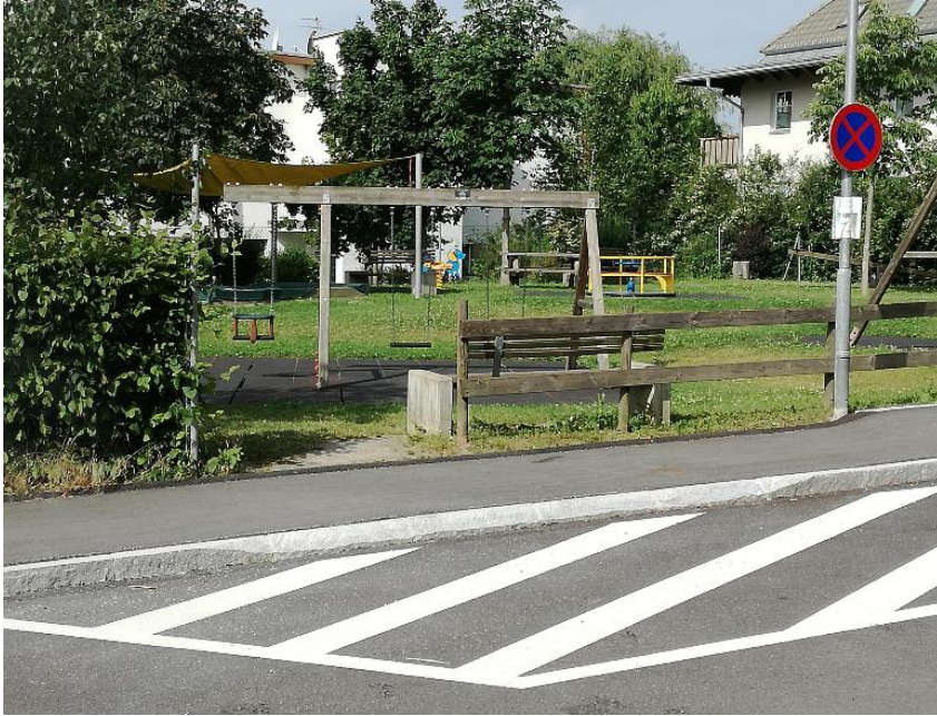
Bild 7: Ungeeignete Abflachung des Gehsteiges