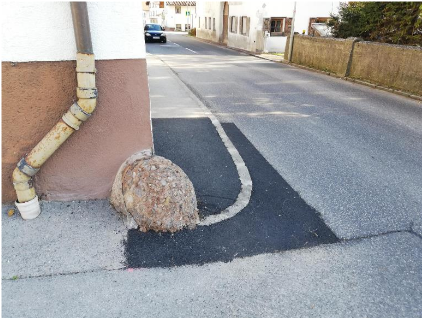
Bild 8: Geeignete Abflachung eines Gehsteiges

In Geschäfte muss man hinein kommen. Bei vielen Geschäften sind Stufen.