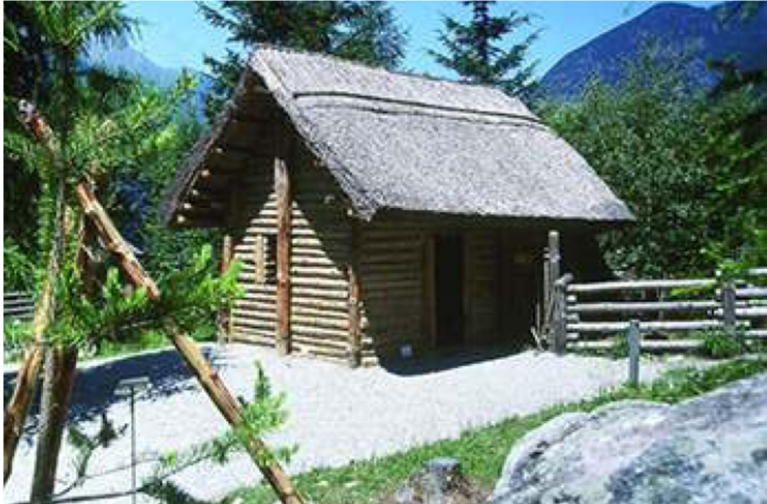
Bild 6: Ötzi-Dorf, Archäologischer Freilichtpark in Umhausen / Ötztal

Geradezu als Symbol für die angesprochene Besonderheit Tirols als wichtigster Alpenübergang in Europa kann man den derzeit wohl berühmtesten „Tiroler“ ansehen: Ötzi, den Mann im Eis, entdeckt am 19.9.1991 am Hauslabjoch bzw. Tisenjoch (3.200 m) inmitten der Ötztaler Alpen. Diese weltberühmte knapp über 5.000 Jahre alte Gletschermumie lag unmittelbar an der heutigen Grenze, am Übergang von Süd- nach Nordtirol. Ötzi wird im Südtiroler Archäologiemuseum, Bozen, ausgestellt. Der archäologische Freilichtpark Ötzi-Dorf in Umhausen, Ötztal , vermittelt den BesucherInnen einen Eindruck des Alltagslebens in der Jungsteinzeit .