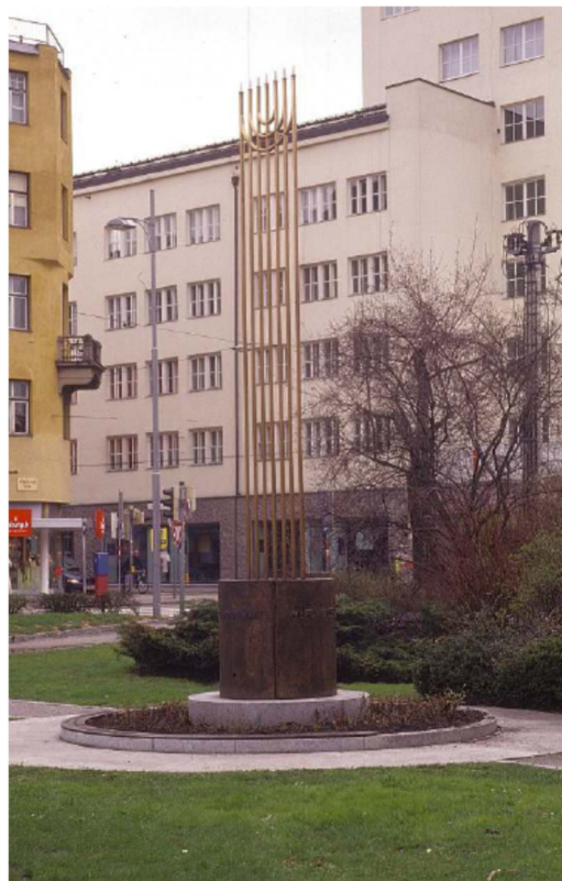
Bild 15: Mahnmal für die Opfer der Pogromnacht (9./10.11.1938) am Landhausplatz, Innsbruck

Ein Höhepunkt dieser menschenverachtenden Haltung war die im gesamten Deutschen Reich organisierte so genannte „ Reichskristallnacht “ vom 9. auf den 10. November 1938 , auch als Novemberpogrom bezeichnet (Pogrom bedeutet Ausschreitung gegen Mitglieder einer Minderheit; daher wird dieses Ereignis heute auch als „ Pogromnacht “ bezeichnet). Dabei starben in Innsbruck vier Menschen durch Stoßtrupps, die sich aus NSDAP-Mitgliedern und SS-Angehörigen zusammensetzten. Das Ziel der Täter waren führende Funktionäre der Israelitischen Kultusgemeinde Innsbrucks.