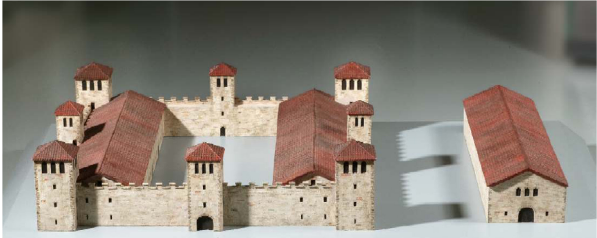
Bild 8: Modell ‚Kastell Veldidena‘ im Tiroler Landesmuseum Ferdinandeum, Innsbruck

Nach dem Zusammenbruch des Römischen Reichs um 500 drangen vorwiegend Baiern, ein germanischer Stamm, in breiter Front von Norden her in das Gebiet des heutigen Tirol ein und vermischten sich nach und nach mit den mittlerweile romanisierten rätischen Einwohnern. Diesen Vorgang nennt man „Bajuwarische Landnahme“.