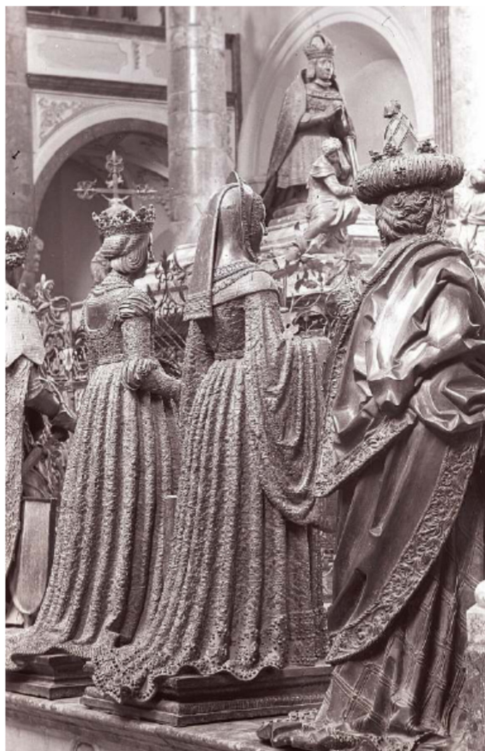
Bild 12: Die „Schwarzen Mander“ am Grabmal Kaiser Maximilians I. in der Hofkirche, Innsbruck

An der Wende zur Neuzeit um 1500 regierte mit Kaiser Maximilian I. ein machtvoller Landesfürst, der das durch den Silber- und Kupferbergbau um Schwaz sowie den Salzbergbau und die Münzprägungen in Hall in Tirol reich gewordene Land zu wirtschaftlicher und kultureller Blüte führte. Für ihn wurde von seinem Enkel Ferdinand in der Innsbrucker Hofkirche ein prächtiges Grabmal errichtet (worin er jedoch nicht beigesetzt ist, sondern in seinem Geburtsort Wiener Neustadt), umgeben von 28 überlebensgroßen Bronzefiguren , den so genannten „ Schwarzen Mandern “ (Verwandte, Zeitgenossen, sagenhafte Figuren). Auch das Zeughaus (Waffendepot) an der Sill in Innsbruck geht auf ihn zurück.