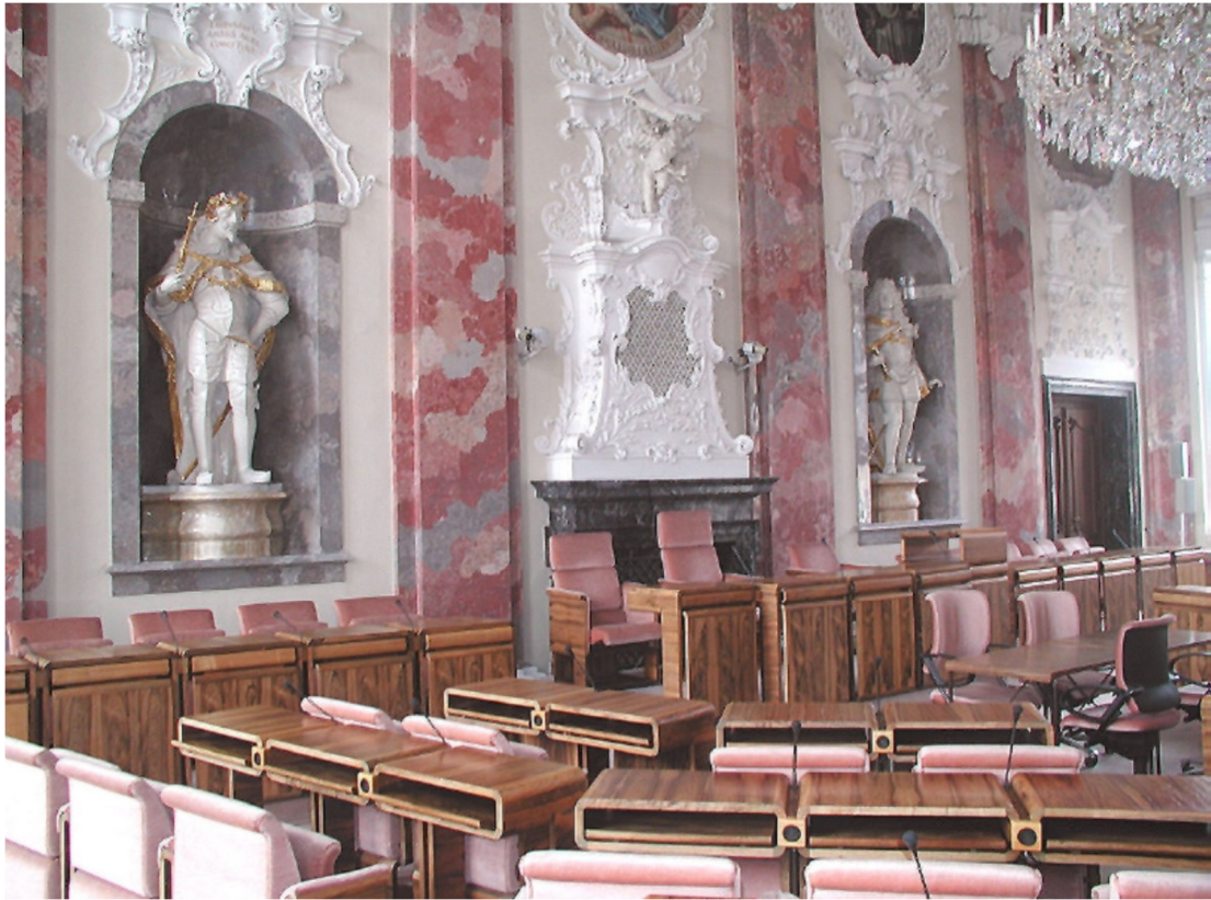
Bild 21: Sitzungssaal des Tiroler Landtags im Alten Landhaus, Innsbruck

Der Tiroler Landtag, das Parlament des Bundeslandes Tirol, übt auf der Grundlage der Verfassung des Landes Tirol (Tiroler Landesordnung 1989) vor allem die Landesgesetzgebung aus (Legislative).