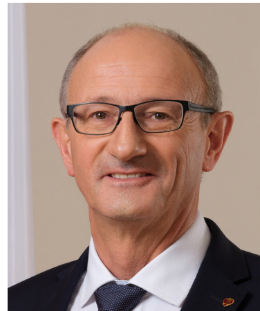
Land Tirol/Emanuel Kaser