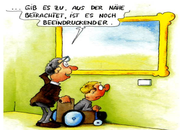
Abbildung 5: Karikatur barrierefreie Museen

Dieser Leit-Faden soll helfen, dass bald alle Veranstaltungen barriere-frei sind.