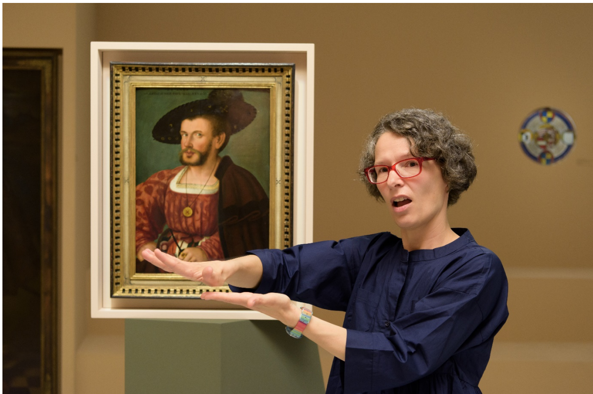
Abbildung 1: Gebärdensprachdolmetscherin bei der Erklärung eines Bildes

Ergänzt wird die Stellungnahme um Überlegungen zur Miteinbeziehung des Themas Behinderung in Museums- und Ausstellungskonzeptionen, die über das Thema Barrierefreiheit hinausgehend die Darstellung und Repräsentation von Behinderung entsprechend dem sozialen Modell der UN-Behindertenkonvention betreffen.