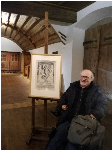
Abbildung 18: Präsentation des Flugblattes mit einem behinderten Mann aus Innsbruck im Jahr 1620 im TVKM