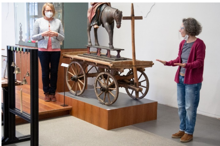
Abbildung 15: Führung mit Gebärdensprachdolmetscher_innen