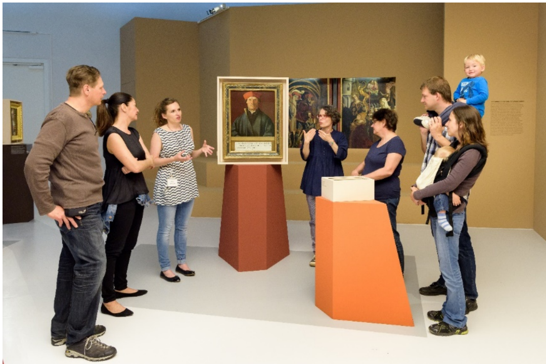
Abbildung 8: Führung im Landesmuseum Ferdinandeum mit Gebärdensprachdolmetscherin