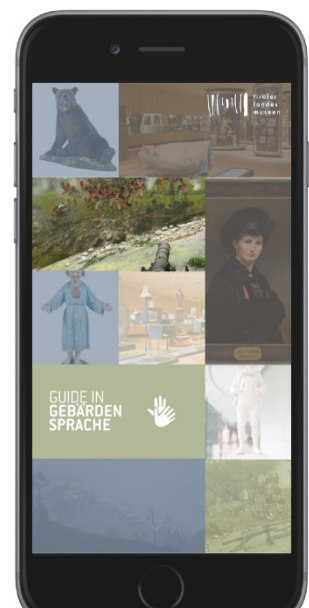
Abbildung 11: Videoguide in Gebärdensprache zur Ausstellung im Tirol Panorama