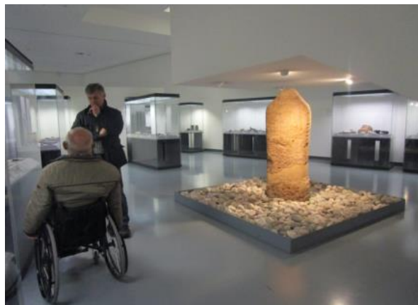
Abbildung 12: Museumsbesuch