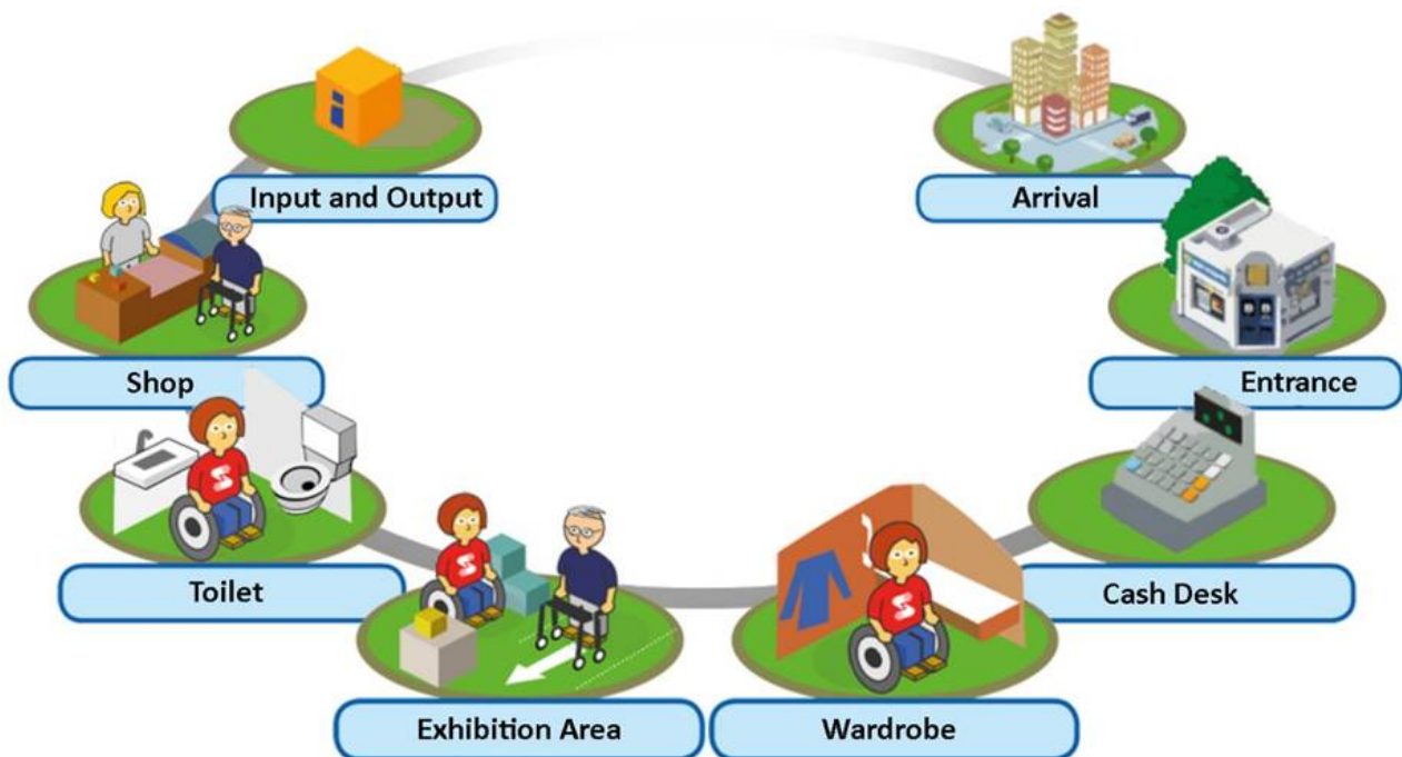
Abbildung 5: barrierefreie Servicekette

Die folgende Abbildung wurde uns vom ÖZIV (Österreichischer Zivilinvaliden-Verband) übermittelt. Sie stellt die wichtigen Punkte für eine barrierefreie Servicekette in einem Museum dar und stammt aus dem Projekt „COME-IN!“ Come-In!.(oeziv.org) . Dieses und das Projekt „FAIR FÜR ALLE“ FAIR FÜR ALLE (oeziv.org) setzen sich für gleichberechtigte Zugänge für Menschen mit Behinderungen ein.