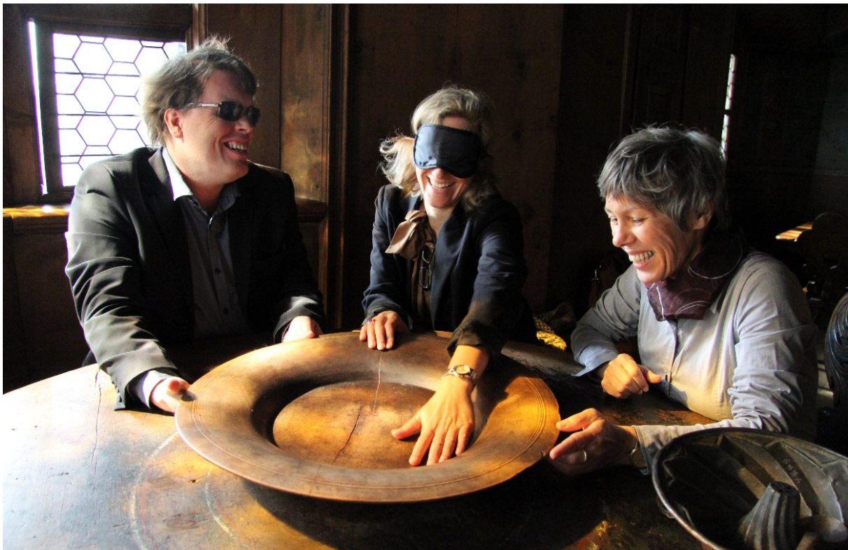
Abbildung 2: Reihe „Fein-geföhlt“ im Tiroler Volkskunstmuseum

h) um die Gestaltung, die Entwicklung, die Herstellung und den Vertrieb barrierefreier Informations- und Kommunikationstechnologien und -systeme in einem frühen Stadium zu fördern, sodass deren Barrierefreiheit mit möglichst geringem Kostenaufwand erreicht wird.