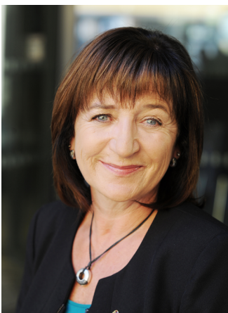
Landesarätin | Assessora Beate Palfrader

La Giornata dei musei dell'Euregio 2016 vede invece gli stessi collaboratori e collaboratrici dei musei del Tirolo, dell'Alto Adige e del Trentino in veste di esperti e relatori, nell'ottica di creare una rete culturale tra i tre territori dell'Euregio. Rifacendosi alla formula internazionalmente consolidata del "world café" l'evento consente di mettere in luce tramite uno scambio diretto le specifiche competenze esistenti e le esigenze concrete degli operatori museali all'interno dell'Euregio, sviluppando modalità per intensificare in futuro gli scambi e il sostegno reciproco tra i musei. Un convegno assolve validamente la sua funzione se consente ai partecipanti di conoscersi meglio tra loro offrendo sufficiente spazio alla costruzione di reti. La Giornata dei musei dell'Euregio 2016 è orientata a perseguire tale obiettivo nell'intento di fornire agli operatori museali dei tre territori riferimenti e reti specifiche all'interno dell'Euregio. Ci rallegriamo della Vostra partecipazione e Vi auguriamo una fruttuosa collaborazione nell'ambito di nuove reti.