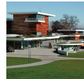
Museum der Phantasie