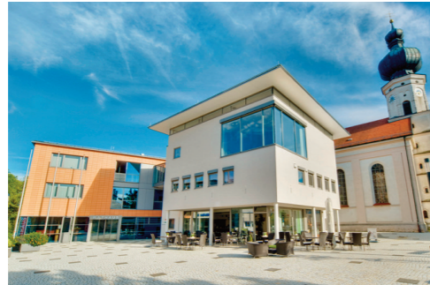
Rathaus Taufkirchen (Vils)