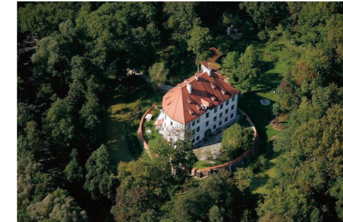
Schloss Altfraunberg (Wasserschloss)