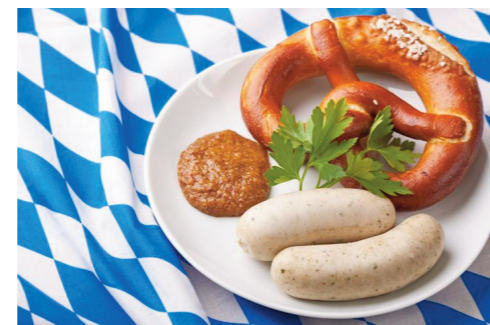
Die »Münchner Spezialität«