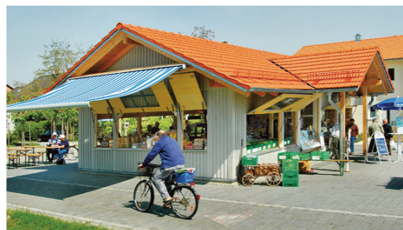
Vilstaler Bauernmarkt in Moosen