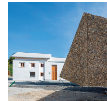
Information über das Konzerthaus Blaibach