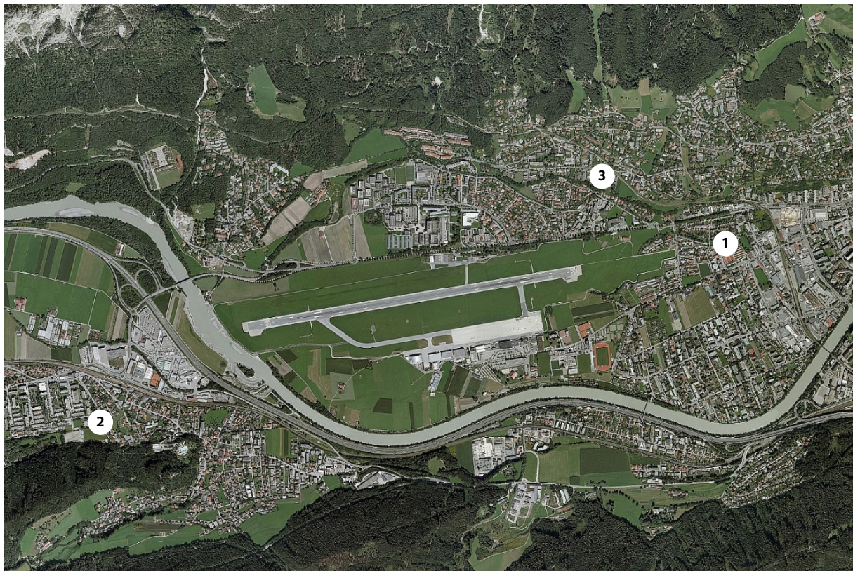
Abbildung 1: Flughafen Innsbruck mit Messstellen

Innsbruck, im Stadtteil Allerheiligen und bei der Mittelschule in Völs.