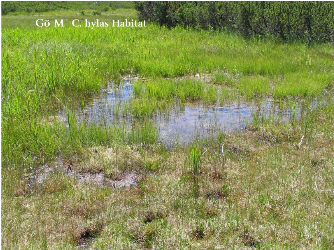
Abb. 12: Moor SE Göfelesee Habitat 1