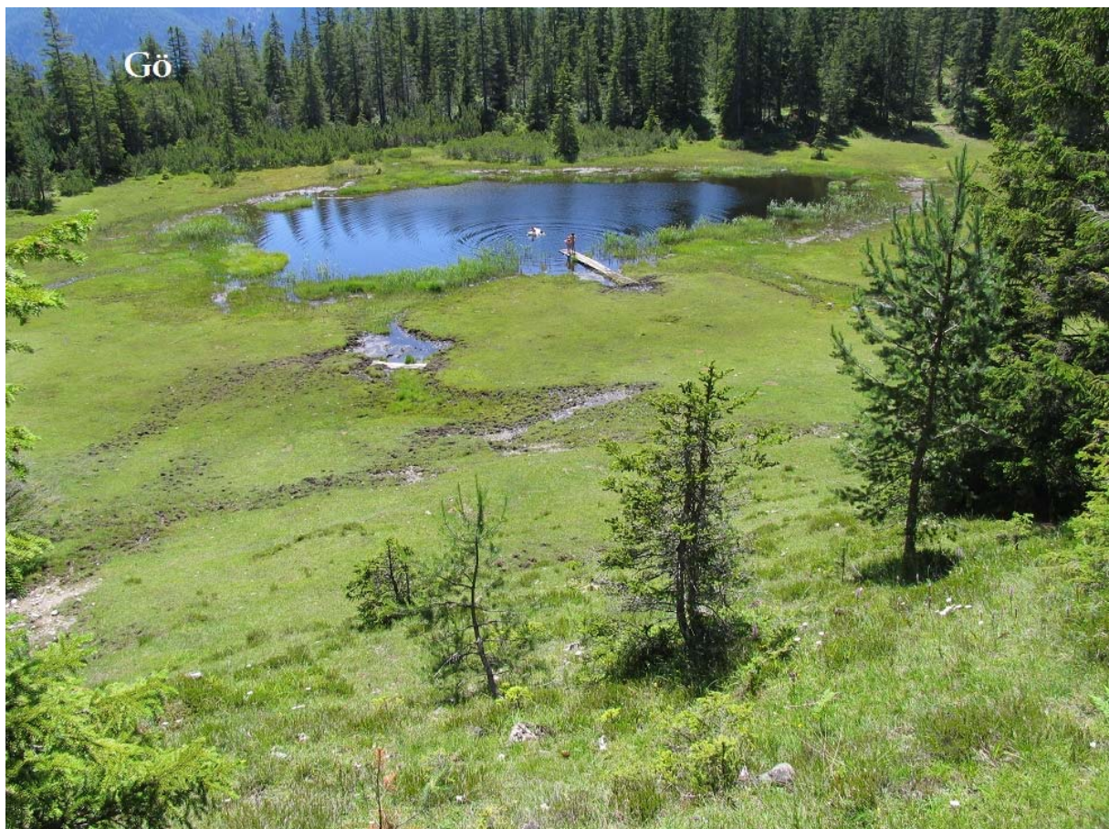
Abb. 3: Göfelesee Übersicht