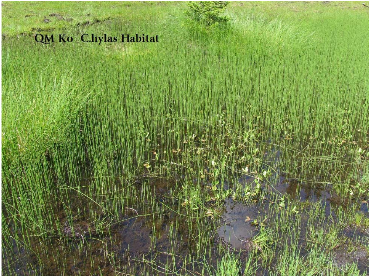
Abb. 17: Quellmoor SE Kohlstattmoor Habitat