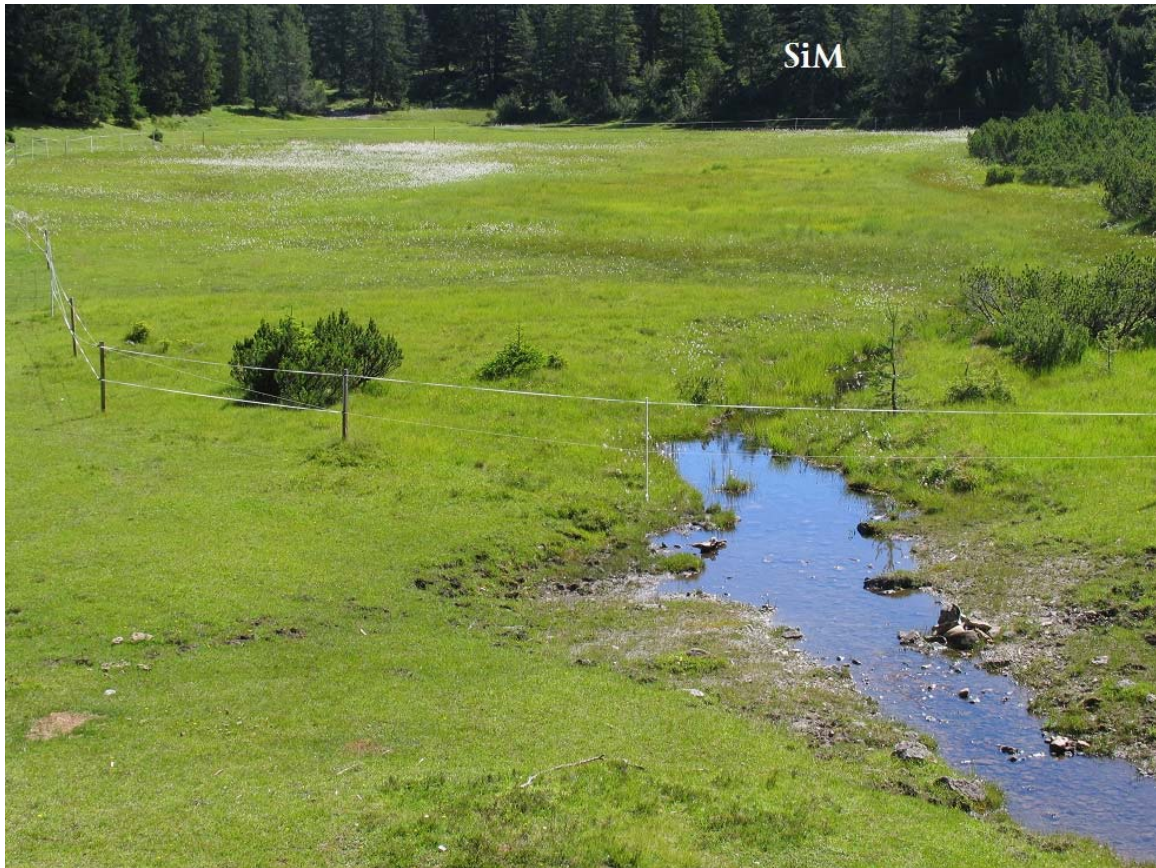
Abb. 8: Moor SE Wallfahrtskirche