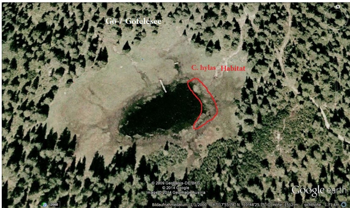
Abb. 2: Göfelesee