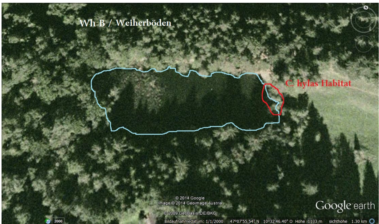
Abb. 18: Großer Teich Weiherböden