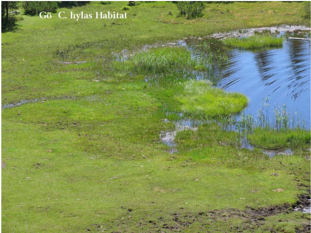
Abb. 4: Göfelesee Habitat