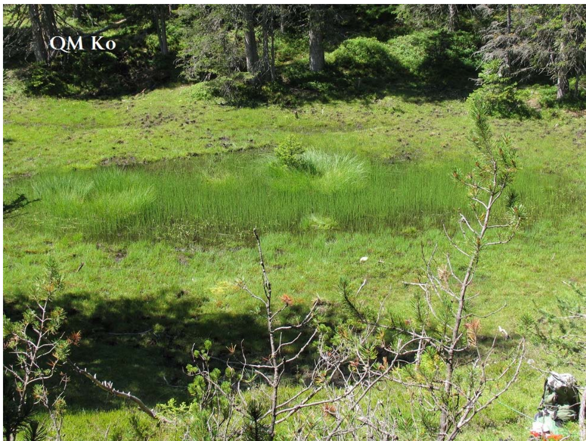
Abb. 16: Quellmoor SE Kohlstattmoor