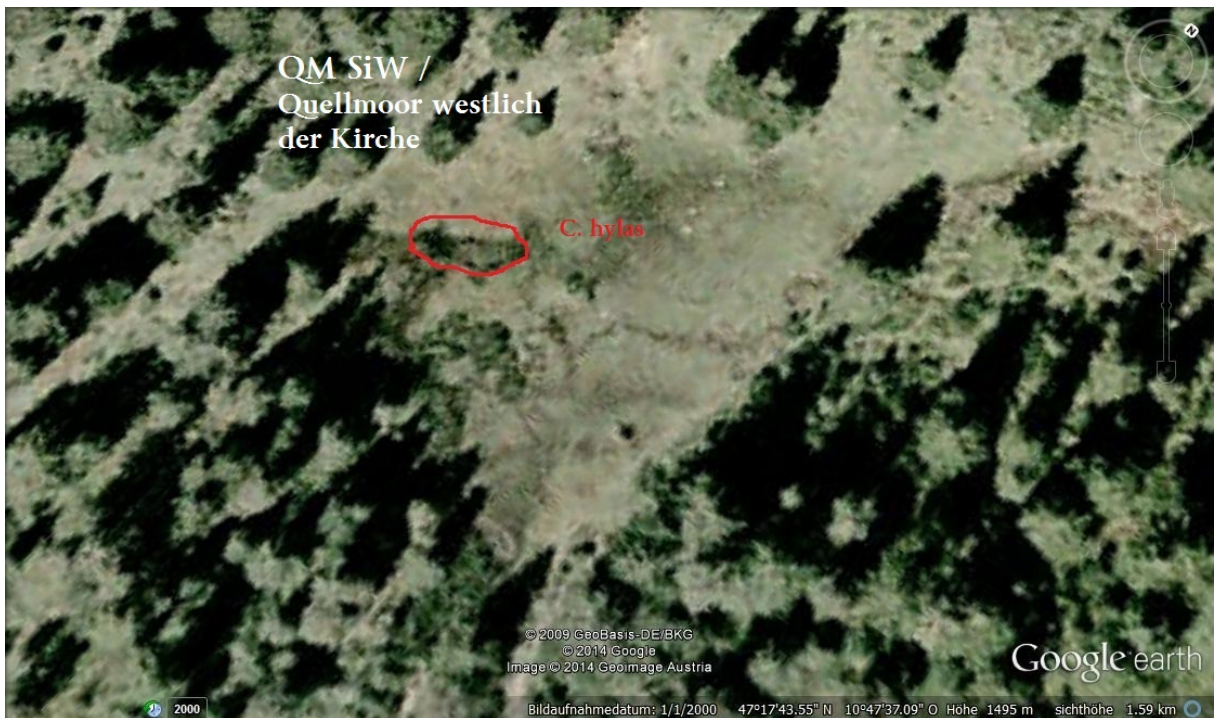
Abb. 5: Quellmoor westlich Wallfahrtskirche