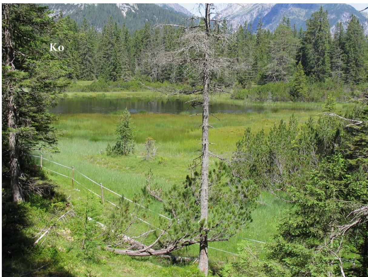
Abb. 15: Kohlstattmoor