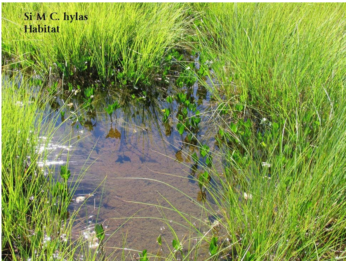
Abb. 9: Moor SE Wallfahrtskirche Habitat