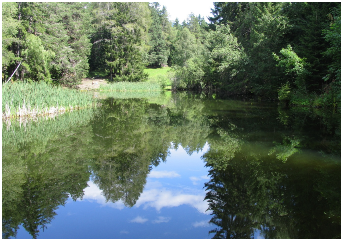
Abb. 19: Großer Teich Weiherboden