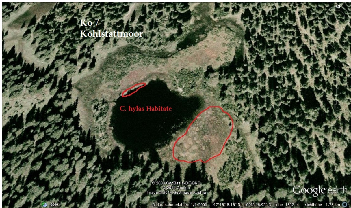
Abb. 14: Kohlstattmoor