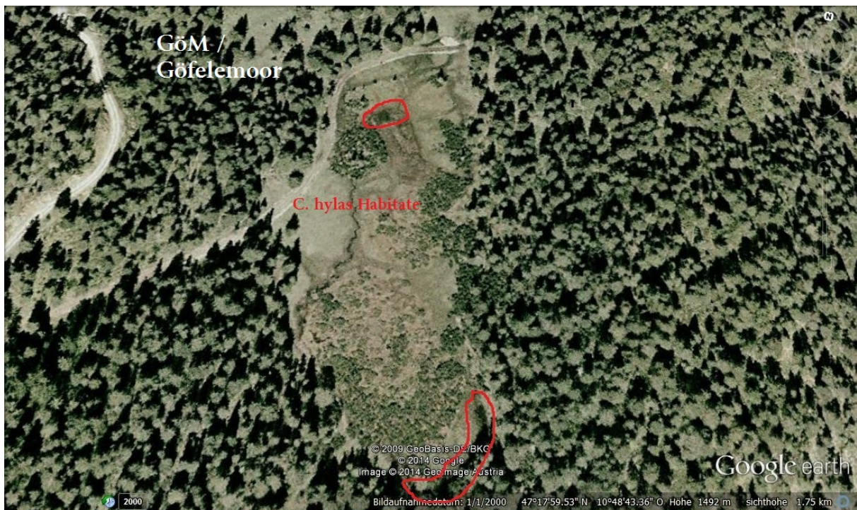
Abb. 10: Moor SE Göfelesee