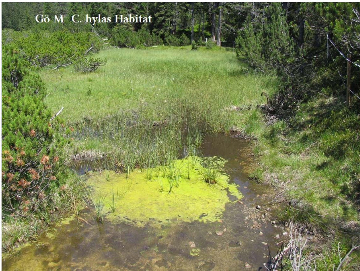
Abb. 13: Moor SE Göfelesee Habitat 2