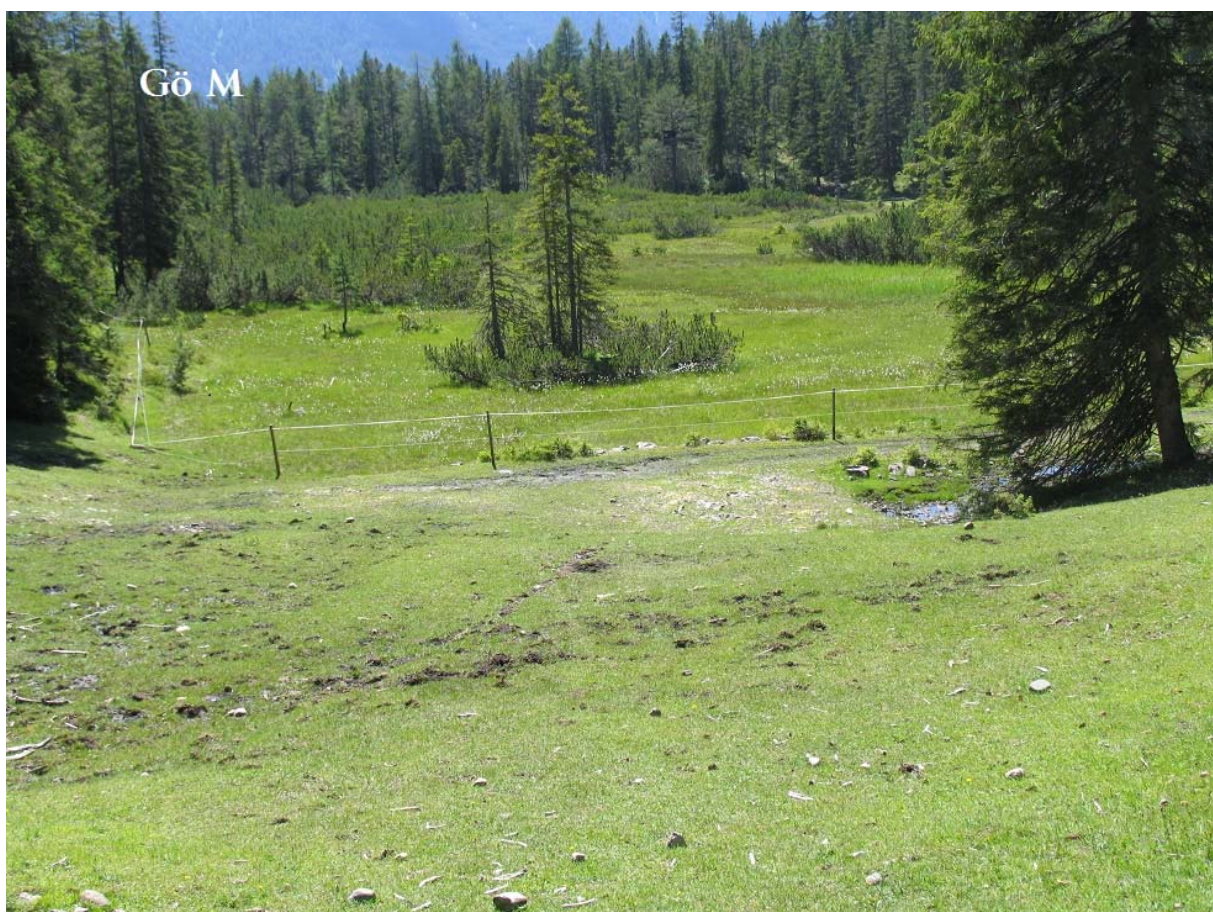
Abb. 11: Moor SE Göfelesee