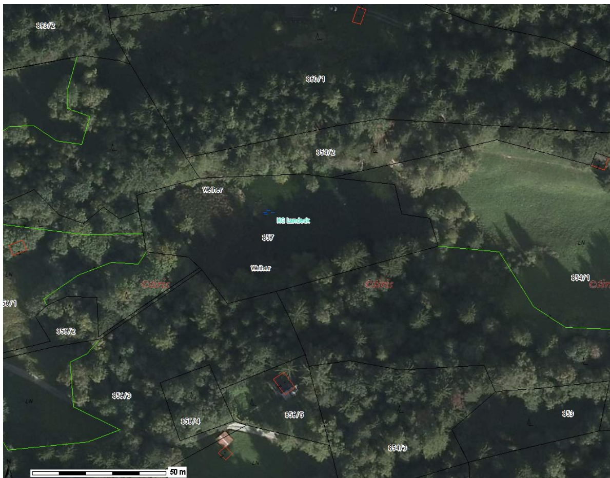
Abb. 18a: Großer Teich Weiherboden