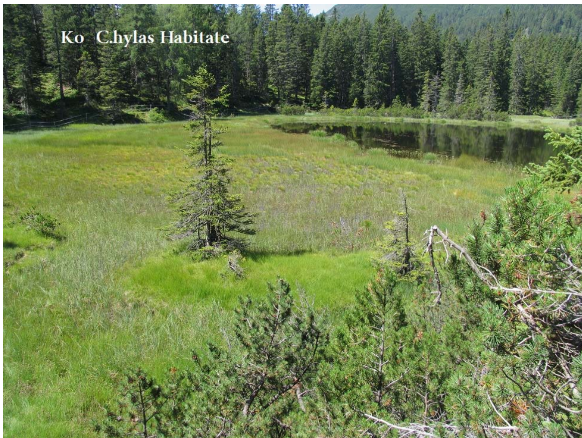
Abb. 15: Kohlstattmoor Habitate Schwinggrasen